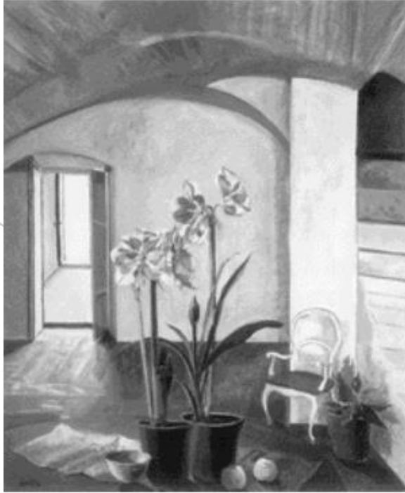
Vicente Gandía, Interior colonial , 2002

“ L egendaria, y a menudo polémica, Pita tuvo una sola pasión: la poesía. Su voz tipluda, su exasperante facilidad para la rima y sobre todo la explosión hormonal de su talento eran un verdadero agasajo de los sentidos. Verdadera joya de nuestras letras”