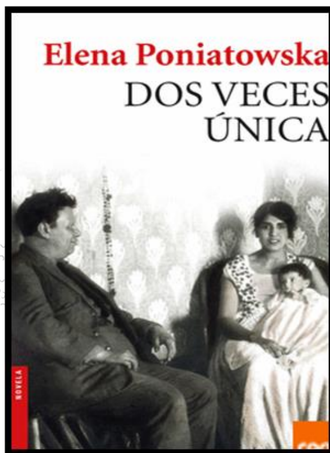
Poniatowska, E. (2018). Dos veces única . Seix Barral: México.

https://planetadelibrosec0.cdnstatics.com/libros_contenido_extra/32/31295_1_DOS_VECES_UNICA.pdf