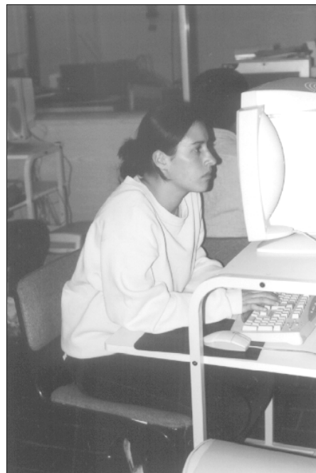
Usaria de Internet en la biblioteca pública “Francisco Zarco” del Distrito Federal.

Cabe destacar que la Unión de Empresarios para la Tecnología en la Educación (Únete) fue