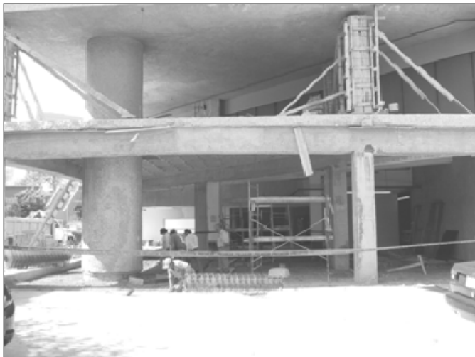
Aspecto de los trabajos de remodelación

➤ La biblioteca crecerá 750 metros cuadrados y tendrá, entre sus nuevas áreas una sala de cómputo e Internet con 35 unidades de servicio