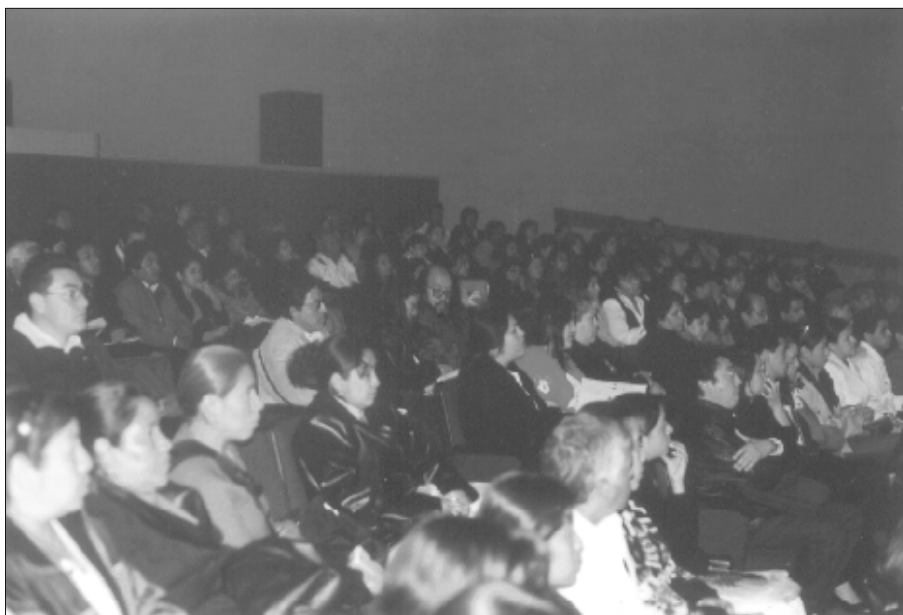
Asistentes al Foro “Perspectivas de la Biblioteca Pública”.

En el marco de la Primera Feria del Libro del Estado de México que se llevó a cabo en Toluca, en el Centro Cultural Mexiquense, del 14 al 16 de febrero se realizó el Foro de Bibliotecarios “Perspectivas de la Biblioteca Pública” que reunió a más de doscientos integrantes de la Red Estatal de Bibliotecas Públicas en el auditorio del Museo de Arte Moderno.