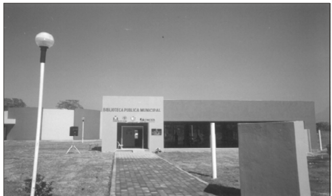
Biblioteca Pública Municipal de Tecomán, Colima

Destacó, por último, el interés que existe en el estado por instalar más bibliotecas, para ampliar las posibilidades de servicio de los colimenses.