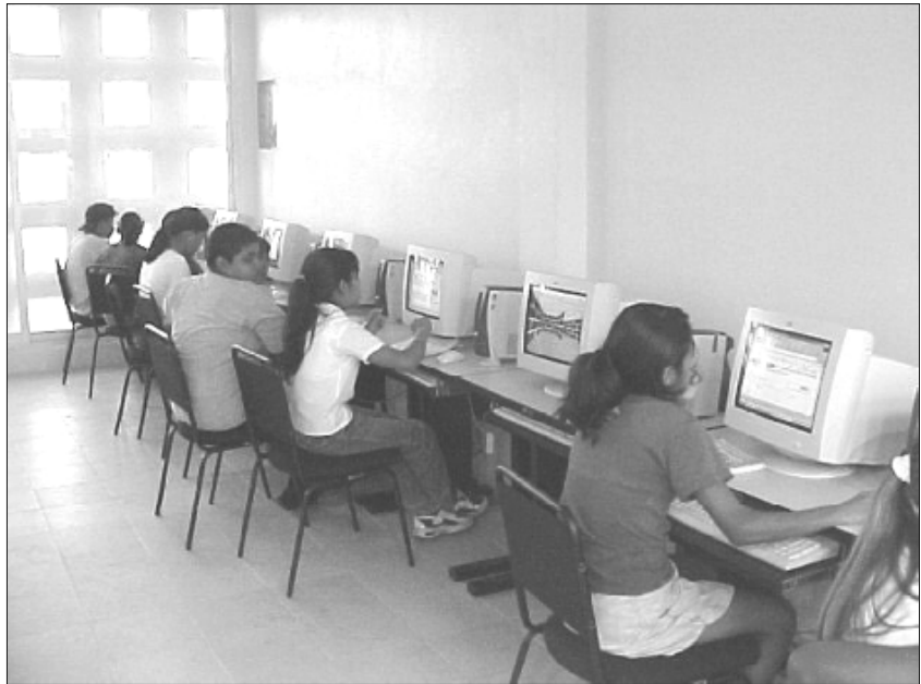
Usuarios de Internet en la biblioteca pública municipal "Cornelius Versteeg van Donselaar" de Coatzacoalcos, Veracruz.

Estas bibliotecas públicas beneficiadas con el programa Internet en mi Biblioteca son la del Centro de Desarrollo Comunitario "La Albarrada", en San Cristóbal de las Casas, Chiapas; "Parque Urawa", en Toluca, Estado México; la Municipal, en Mochochá, Yucatán; "Profesor Eduardo Vera Gutiérrez", en Zapotlán de Juárez, Hidalgo; "Compañía Minera de Cananea", en Cananea, Sonora; "Profesor Gabriel López Chirinos", en Juchitán, Oaxaca; "Profesor Raúl