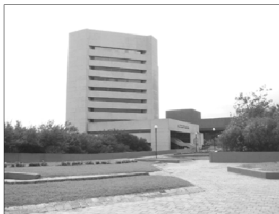
La Biblioteca Central del Estado de Nuevo León fue inaugurada en 1986.

De esta forma, la Biblioteca Central del Estado de Nuevo León optimizará sus instalaciones para beneficio de todos los nuevoleonenses.