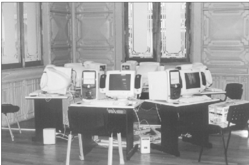
Módulo de Internet en mi Biblioteca , en la biblioteca del “Palacio de Hierro” de Orizaba, Veracruz.

En una etapa posterior de este programa se tiene contemplado beneficiar a otras 30 bibliotecas públicas de diversas entidades federativas.