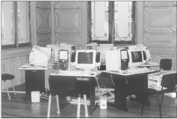
Módulo de Internet proporcionado por la Fundación Únete.

El edificio, que es único en su tipo en todo el país, fue traído de Bélgica en tres barcos entre los años 1891 y 1894 y, desde su instalación, estuvo destinado a albergar los poderes municipales. En efecto, a lo largo de 97 años fue sede de estos poderes y, a partir de ahora, funcionará como el más importante centro cultural de la ciudad, pues dará cabida a la biblioteca pública, a una sala de usos múltiples, una Galería de la Cerveza y una Galería del Café, conjuntando así algunos de los referentes de la actividad cultural y productiva más destacada de esta progresista población veracruzana.