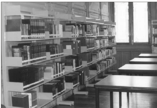
Aspecto parcial de la Sala de Consulta.

Dadas sus características, la Biblioteca Pública Municipal “María Enriqueta Mac Naught” (que lleva este nombre en honor de una destacada poetisa orizabeña) es una de las mejores de Veracruz, instalada en el ala poniente de un edificio del patrimonio histórico orizabeño que es un gran