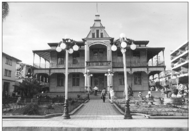
Fachada del centro cultural que alberga a la Biblioteca Pública Municipal de Orizaba.

Además, la Biblioteca Pública Municipal “María Enriqueta Mac Naught” es la primera biblioteca pública puesta en marcha como punto de acceso del Sistema e-México; y la primera, también, que ha sido equipada con computadoras bajo el esquema de la Fundación Únete.