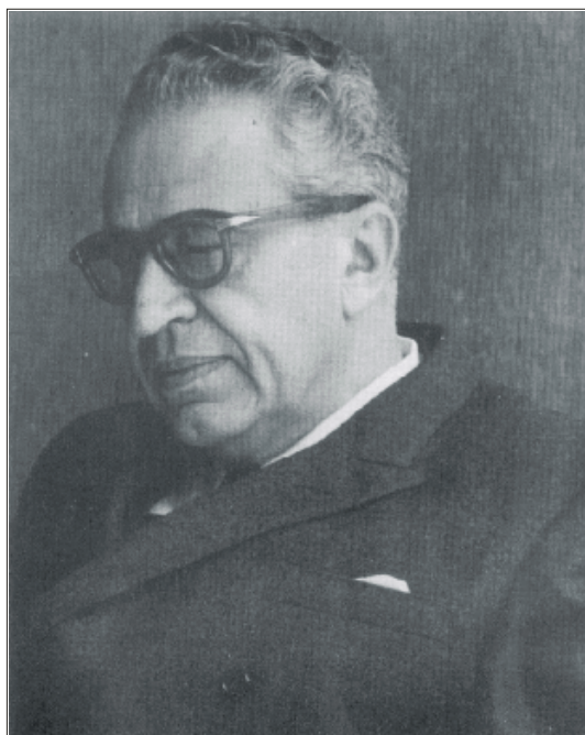
Jaime Torres Bodet.

Se ha dicho, con razón, que Torres Bodet sacrificó su obra literaria de creación personal, en aras de una labor educativa y cultural de servicio que contribuyó enormemente a la modernización de México. Pese a ello escribió libros