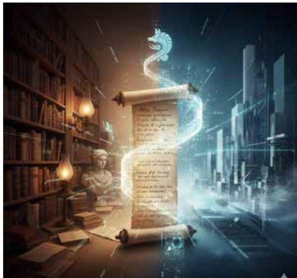
Imagen generada por IA de Google (Gemini)

Creo que hay que desembocar en la máxima pluralidad, en la experimentación de múltiples prosodias, de las poéticas disímiles. Desde el discurso profundo, desde el turbión de las confusas mezclas del fondo corporal, hasta el remonte a las alturas del discurso abstracto, traslúcido. 4