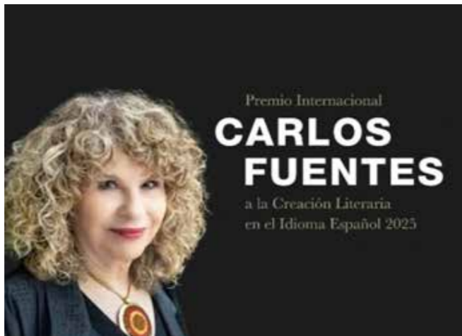
Gioconda Belli

Su primer poemario, Sobre la grama (1972), ya delineaba las coordenadas de su universo literario: la intimidad y la militancia no son compartimentos estancos, sino vasos comunicantes. Sin embargo, fue Línea de fuego (1978), galardonado con el prestigioso Premio Casa de las Américas en La Habana, el que la consolidó como una voz imprescindible. En estos versos, Belli logra una alquimia perfecta: la crónica de la lucha sandinista se entrelaza con la experiencia personal del exilio, el amor clandestino y la esperanza de un futuro liberado. La poeta se apropia del lenguaje para despojarlo de eufemismos y dotarlo de una franqueza que desarma.