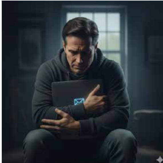
Imagen generada por IA de Google (Gemini)

El amor cambia, no permanece y difícilmente se encuentra paz y tranquilidad con él. El amor es incierto y, al mismo tiempo, las personas lo hacen así ya que cambian, evolucionan, no son automáticos como una máquina que acepta, recibe y manda afecto o información. La carta se encuentra en desuso, pero, de momento, trata de resistirse a su desaparición.