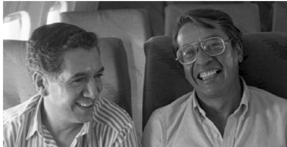
René Avilés Fabila y José Agustín

Por otra parte, en Historia de la literatura mexicana: desde los orígenes hasta nuestros días , de Carlos González Peña, en su apéndice, elaborado por el