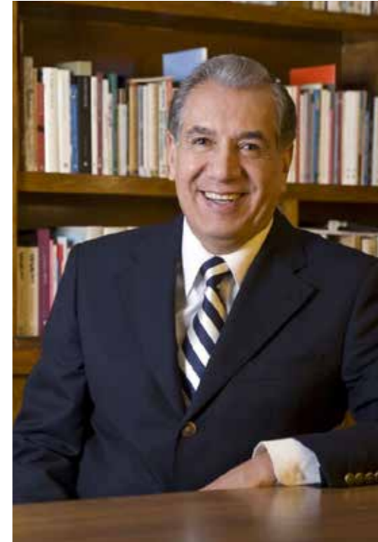
René Avilés Fabila

Según la historia —la cual no llega a ser siempre justa—, se adscribe a René Avilés Fabila al grupo generacional denominado “literatura de la Onda”, nombrado así por Margo Glantz. La escritora mexicana con ascendencia ucraniana —por parte de sus padres— definió a la Onda como: