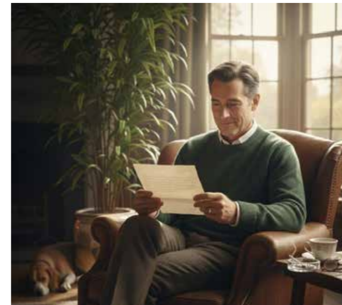
Imagen generada por IA de Google (Gemini)

Para concluir la sección, Roland Barthes define la carta amorosa, en sus Fragments de un discurso amoroso , como: “Carta: La figura enfoca la dialéctica particular de la carta de amor, a la vez vacía (codificada) y expresiva (cargada de ganas de significar el deseo) como deseo, la carta de amor espera su respuesta; obliga implícitamente al otro a responder, a falta de lo cual su imagen se altera, se vuelve otra (1993: 38-39)”. La propuesta de Barthes entiende que los amorosos practican, en la carta, un lenguaje íntimo y propio, el cual no sale de ambos participantes y nadie más puede decodificar el mensaje encriptado. La carta de los enamorados desea una respuesta, no son gratuitas, se desea saber del otro, sino se consigue se alteran los recuerdos, memorias y momentos. Después de todo, la memoria es incierta y construye escenarios que difieren de la realidad.